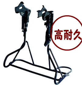
カチオンフラック